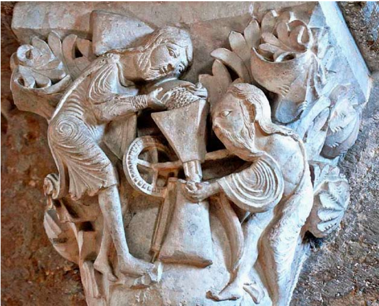
Kapitell mit Paulus und Moses, Sainte Marie-Madeleine, Vézelay, 12. Jahrhundert.

Aber sehen wir uns noch den Schlussabschnitt des Kapitels an: „Von solcher Hoffnung erfüllt, treten wir mit grossem Freimut auf, nicht wie Mose, der sein Angesicht mit einer Hülle bedecken musste, damit die Israeliten nicht das Ende dessen sähen, was vergeht. Aber auch ihre Gedanken wurden verhärtet. Denn bis zum heutigen Tag liegt dieselbe Hülle auf dem alten Bund, wenn daraus vorgelesen wird, und sie wird nicht weggenommen, weil sie nur in Christus beseitigt wird. Ja, bis heute liegt eine Hülle auf ihrem Herzen, sooft aus Mose vorgelesen wird. Sobald sie sich aber dem Herrn zuwenden, wird die Hülle hinweggenommen. Der Herr aber, das ist der Geist; und wo der Geist des Herrn ist, da ist Freiheit. Wir alle aber schauen mit aufgedecktem Antlitz die Herrlichkeit des Herrn wie in einem Spiegel und werden so verwandelt in die Gestalt, die er schon hat, von Herrlichkeit zu Herrlichkeit, wie der Herr des Geistes es wirkt“ (3,12-18).