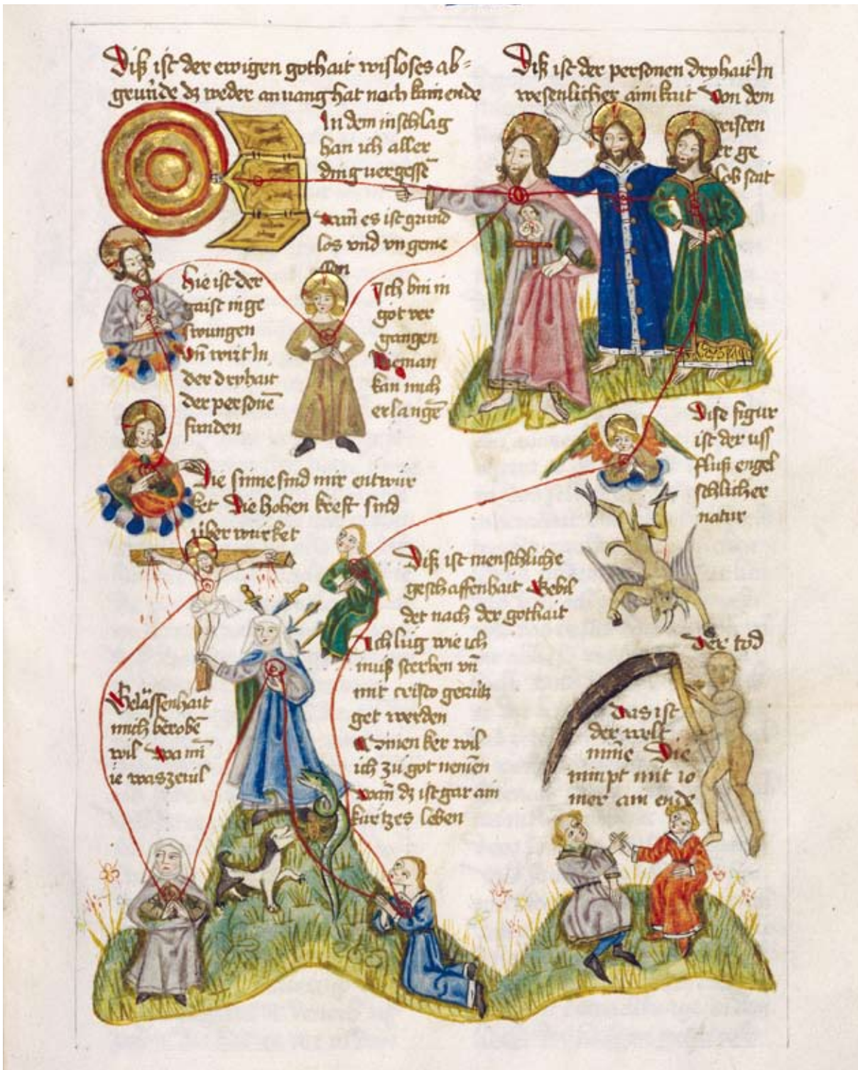
Heinrich Seuse, Exemplar, nach 1455, Stiftsbibliothek Einsiedeln, Cod. 710 (322), fol. 106r.

tion von Materialität auf das Substrat der Kommunikation, eine Ausblendung der kulturellen und semantischen Bedingungen, unter denen Kommunikation stattfindet.