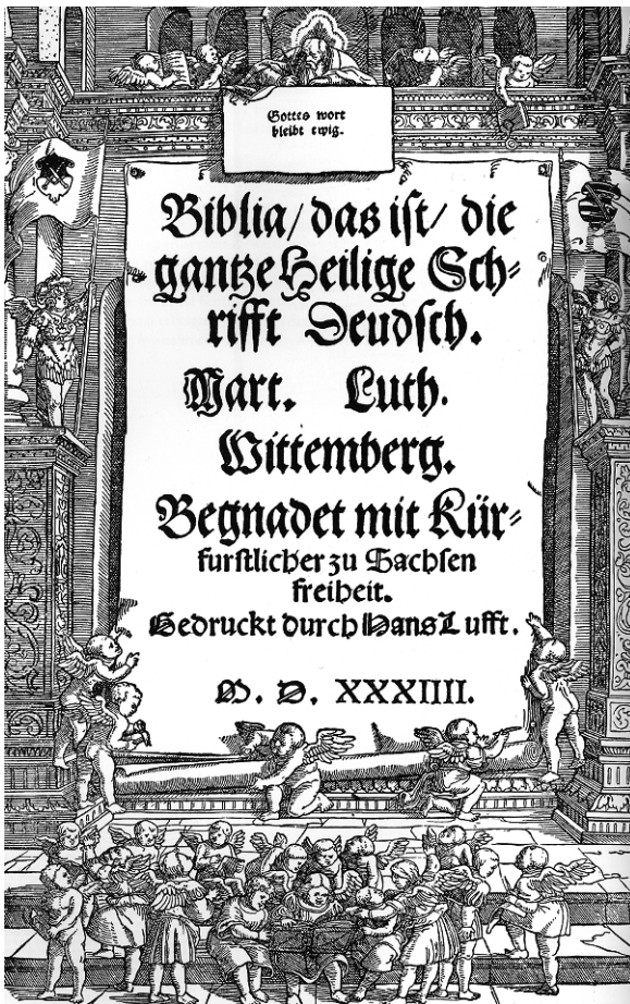
Abb. 4: Biblia, das ist, die gantz Heilige Schrift Deusch. Wittenberg 1534. Titelblatt/Holzschnitt.

eines wahren Gesprochenen« verwandeln. 10 Das gedruckte Wort wurde so zum Medium einer Verheißung, die zu erkennen und zu ergreifen bedeutete, sich seiner Erlösung gewiss zu sein. 11