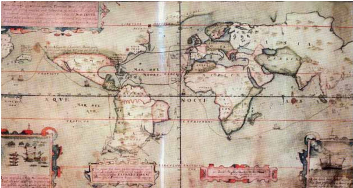
Abb. 2: The Drake-Mellon World Map [nach 1586. Ms. Yale Center for British Art, Paul Mellon Collection].

eines Raum-Skripts. Dies gilt selbstverständlich auch für Weltumrundungen, die auf frühneuzeitlichen Weltkarten oft in Form eines spezifischen Parcours auftauchen, der in die ansonsten ›neutrale‹ Grundfläche der Karte die Ereignishaftigkeit einer einmaligen Handlung einträgt. Dies ist zum Beispiel der Fall in der um 1540 herum in der Werkstatt des in Venedig tätigen Genueser Kartographen Battista Agnese entstandenen Weltkarte (Abb. 1), die die erste Weltumsegelung Magellans festhält und neben der Reiseroute selbst auch den geopolitischen Anspruch auf die Beherrschung der ganzen, als umfahrbar dargestellten Welt durch Spanien darstellt.