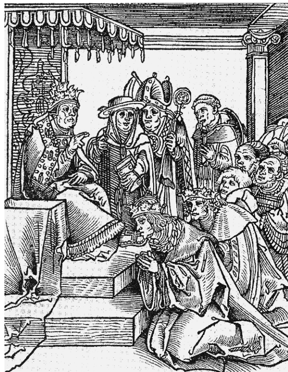
Abb. 3: Passional Christi und Antichristi . Wittenberg 1521. Holzschnitt (Ausschnitt).

Magdeburg ist, betrachtet man das Zeitalter der Reformation unter der Perspektive von Medialität und Historizität, in zweierlei Hinsicht besonders interessant. Erstens steht es exemplarisch für eine spezifische Zeitlichkeit der Reformation, die gekennzeichnet ist durch die Dimensionen von Ende und Wiederholung. Diese Dimensionen entfaltete die Reformation, wie im Folgenden zunächst ausführlicher gezeigt werden soll (II.), von Beginn an unter der Prämisse des Schriftprimats, der im Druckmedium seine materialen Voraussetzungen fand. Magdeburg ist jedoch nicht nur ein Exempel für die reformatorische Zeit der Schriftlichkeit, sondern es ist auch ein Ereignis, das sich durch diese Zeitlichkeit als ein historisches ausbildet und abschließt. Mit Magdeburg und e r s t mit Magdeburg bekam die reformatorische Zeitlichkeit eine historische Wendung. Das heißt nicht, dass die Reformation vorher ein virtuelles Ereignis war. Vielmehr geht es darum, dass durch Magdeburg die Reformation als historisches Ereignis zeitgenössisch reflexiv wurde, und zwar dadurch, dass sie wiederholt wurde. Auch hierbei spielte der Druck eine zentrale Rolle. Ende und Wiederholung, vormals die Zeit des reformatorischen Schriftverständnisses, wurden zur historisch-manifesten Zeitlichkeit des Ereignisses der Reformation selbst. Dies soll, nach einer kurzen Zwischenüberlegung (III.), im zweiten Hauptteil ausführlicher dargestellt werden (IV.).