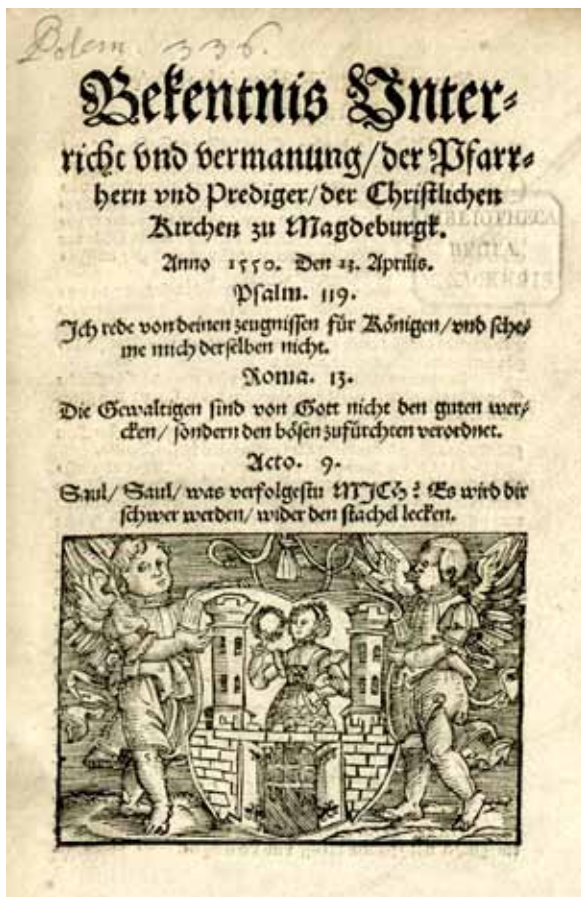
Abb. 6: Nikolaus von Amsdorf (Hg.): Bekentnis Vnterricht vnd vermanung / der Pfarherrn vnd Prediger / der Christlichen Kirchen zu Magdeburgk . Magdeburg 1550. Titelblatt.

Intention der Reformation machen. Man bewegte sich stets innerhalb des durch das Gotteswort abgesteckten Horizonts und vollzog nur das, was in diesem immer schon angelegt war. Ende und Wiederholung bestimmten die Theologie der Reformation, und Ende und Wiederholung waren damit auch die Parameter ihrer historischen oder besser heilsgeschichtlichen Entfaltung. Im Selbstverständnis der Reformatoren war es geradezu das heilsgeschichtliche Charakteristikum der Reformation, dass sie die Kette der Überlieferung, der die mittelalterliche Theologie verpflichtet gewesen war, durchbrach und an ihre Stelle Dispositionen, Diskontinuitäten und Ereignisse setzte. Verbum Dei et traditiones hominum pugnant , so stellte Luther schon in den 1520er Jahren fest, non aliter atque Deus ipse et Satan sibi invicem adversantur et alter alterius opera dissolvit et dogmata subruit . 16