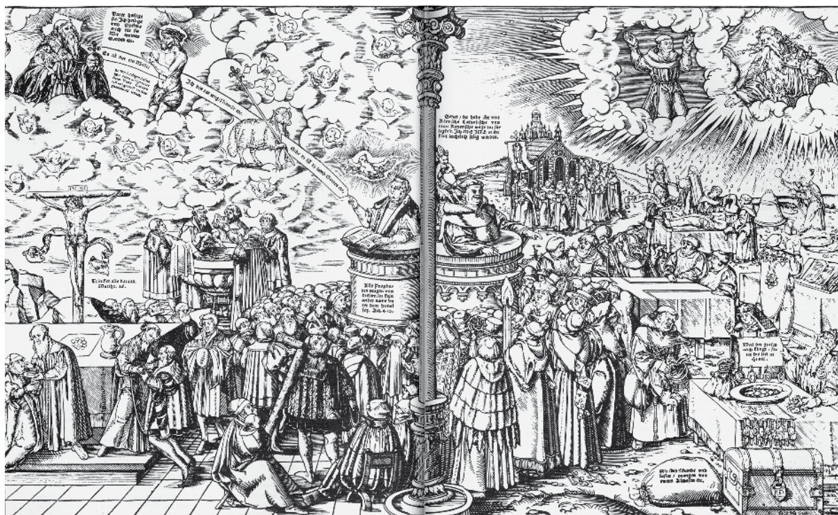
Abb. 5: Unterscheid zwischen der waren Religion Christi / und falschen Abgöttischen Lehr des Antichrists [...]. Magdeburg [um 1550]. Einblattdruck/Holzschnitt.

des Gotteswortes. Die reformatorische Lehre war also eine Wissensform, die sich nicht endgültig festschreiben ließ. Sie bekam ihren Sinn in den Bewegungen, Übergängen und Verschiebungen, die sie erzeugte, und nicht in den Ergebnissen, die sie formulierte. Diese Zeitlichkeit der bibel-exegetischen Erkenntnis machte Luther in seiner Bestimmung des Glaubens als proficere, hoc est semper a novo incipere 13 deutlich: »[D]its leben [ist] nit ein frumkeit, sondern ein frumb werden [...], nit eyn wesßen, sunderen ein werden, nit ein ruge, sondern eyne ubunge.« 14 Die in der Bibel begründete Erkenntnis bezog sich also nicht nur auf die apokalyptische Zeitenwende, sondern die Zeitenwende war umgekehrt auch die Form der Erkenntnis und der Frömmigkeit selbst – das, was mit dem religiösen Wissen und der religiösen Erfahrung geschah und epistemologisch nicht einzuhegen war. 15