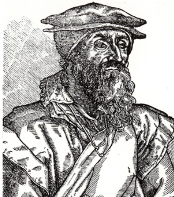
Abb. 1: Matthias Flacius Illyricus. Einblattdruck mit Holzschnitt von Tobias Stimmer. Straßburg 1577.

der Lage beschlossen die meisten, darunter auch Luthers alter Weggefährte Melanchthon, sich in das Unvermeidliche zu fügen, ja sogar das Interim theologisch mitzutragen. Selbst die reformatorische Stadt schlechthin – Wittenberg – war so zu einem Ort protestantischer ›Renegaten‹ geworden, die den wieder eingeführten Kultus und die überkommenen Riten zu Adiaphora , also zu ›Mitteldingen‹ erklärten, die auf das jenseitige Heil keinen Einfluss besäßen. So versuchte man, zumindest das Seelenheil der Rechtgläubigen zu retten. Die Reformation jedoch schien verloren.