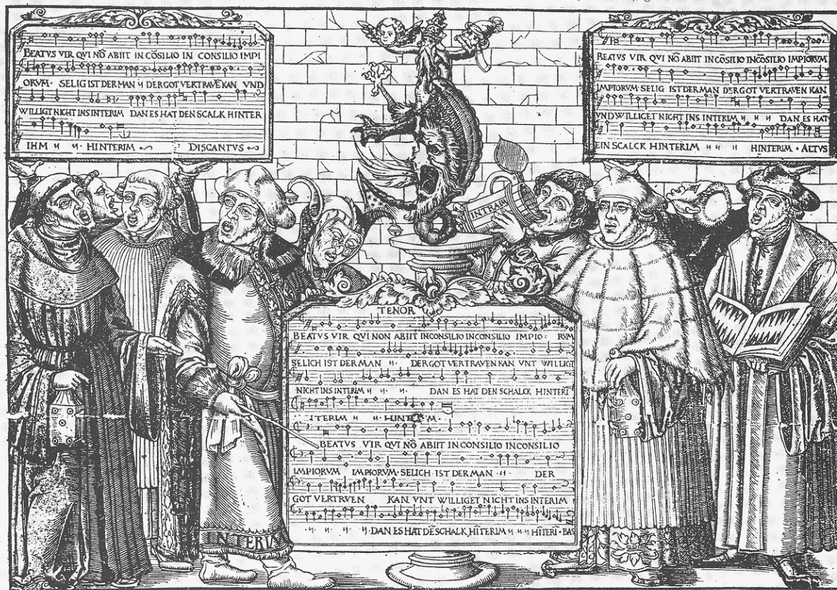
Abb. 7: Des Interims und Interimisten warhafftige abgemalte figur [...]. Magdeburg [um 1550]. Einblattdruck/Holzchnitt.

Vielleicht könnte man aber auch, in einem eher assoziativen Anschluss an Gilles Deleuze, 18 sagen, dass die Reformation selbst eine Art Falte war, nämlich die Falte einer Genese, die ihren eigenen Abschluss berührte – die also aufhörte zu generieren oder sich zu regenerieren, die aber genau dadurch Räume für andere Möglichkeiten entstehen ließ: Möglichkeiten für Imaginationen und Übertragungen, für Konversionen und nicht zuletzt für Erlösungen.