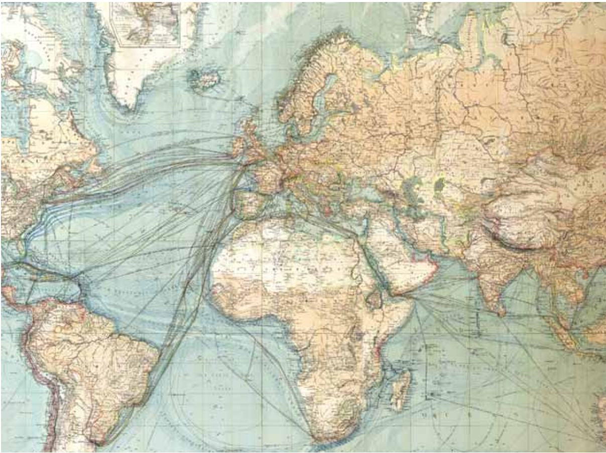
Abb. 3: Heinrich Berghaus' »Allgemeine Weltkarte in Mercator's Projection« [Ausschnitt aus der Ausgabe von 1885].

jedoch nicht bedeuten, dass damit das Raum-Skript als Matrix des Erzählens ausgedient hätte. Es kehrt spätestens mit der Planbarkeit von Weltreisen im Zuge des ›Weltverkehrs‹ wieder – und damit komme ich zu meinem zweiten Analyseteil.