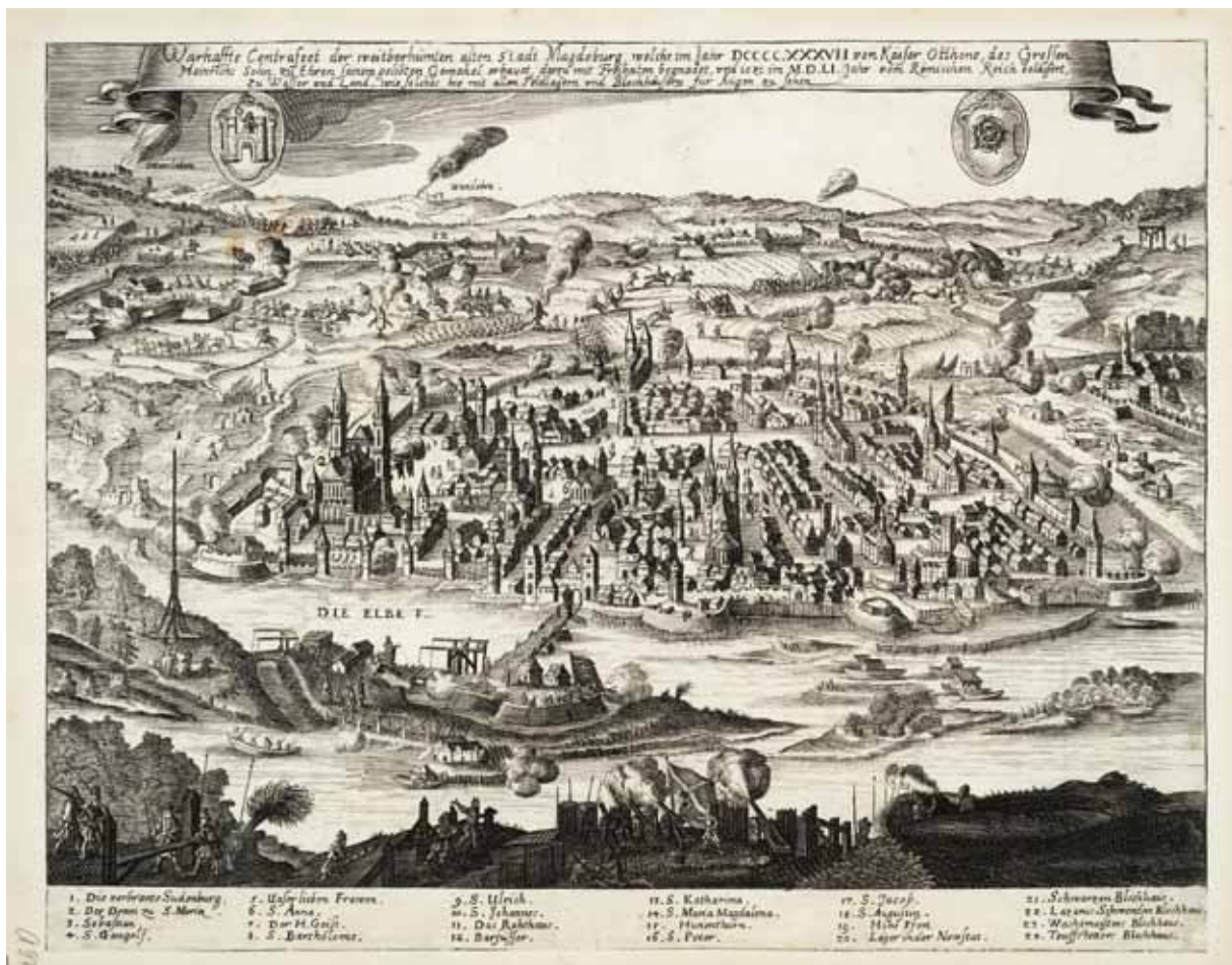
Abb. 2: Warhafte Contrafeet der weitberühmten alten Stadt Magdeburg, welche [...] im M.D.LI. Jahr vom Römischen Reich belagert, zu Wasser und Land, wie solches hie mit allen Feldlagern und Blochhäusern für Augen zu sehen. Magdeburg 1552. Radierung.

deres bedeutete, als sich auf die Seite des Teufels selbst zu stellen. Durch Kompromisse ließen sich demnach die Seelen nicht retten; im Gegenteil, sie waren ihr Verderben. Unter diesen Vorzeichen versammelte man sich in der Stadt Magdeburg, um hier unter der Führung des ehemaligen Wittenberger Hebräischlektors Matthias Flacius Illyricus (Abb. 1) eine letzte Bastion der Reformation zu errichten.