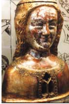
Abbildungen aus Ralf König: Das Ursula-Projekt. Elftausend Jungfrauen. Köln 2013.

Bestimmte Orte zogen während der Reise auf Grund ihrer komplexen Konstellationen von Zeichen der Heiligkeit die Aufmerksamkeit besonders auf sich. So zum Beispiel die Goldene Kammer der Basilika St. Ursula in Köln, die als Beinhaus das Heilige in Form unzähli-