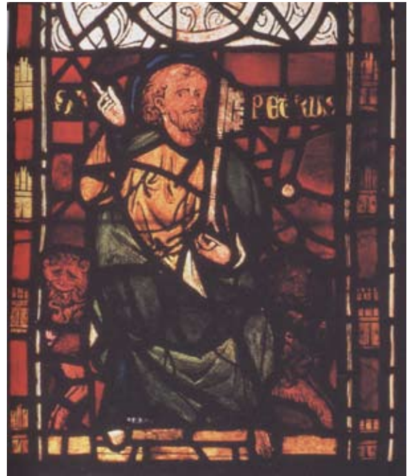
Abb. 4: Petrus, ehemals Rouen, Schlosskapelle, um 1270; heute im Musée nationale du Moyen Age et des Thermes de Cluny.

Aber auch wenn Inschriften kaum lesbar sind, aneinander gereimte Buchstaben keinen Sinn ergeben oder ihr Inhalt sich als banal herausstellt, können sie unabhängig von ihrer Zeichenfunktion dazu dienen, die lichtdurchlässige Materialität der gläsernen Buchstaben hervorzuheben. Im Hochmittelalter wurden Inschriften nämlich meist nicht mit Farbe und Pinsel auf ein Glasstück aufgetragen, sondern in Negativtechnik aus einer noch nicht eingebrannten dunklen Schwarzlotschicht herausgeschabt. Der Mönch Theophil gibt am Beginn des 12. Jahrhunderts in seinem Traktat zur Glasmalerei die folgenden Anweisungen zum Anbringen von Inschriften: