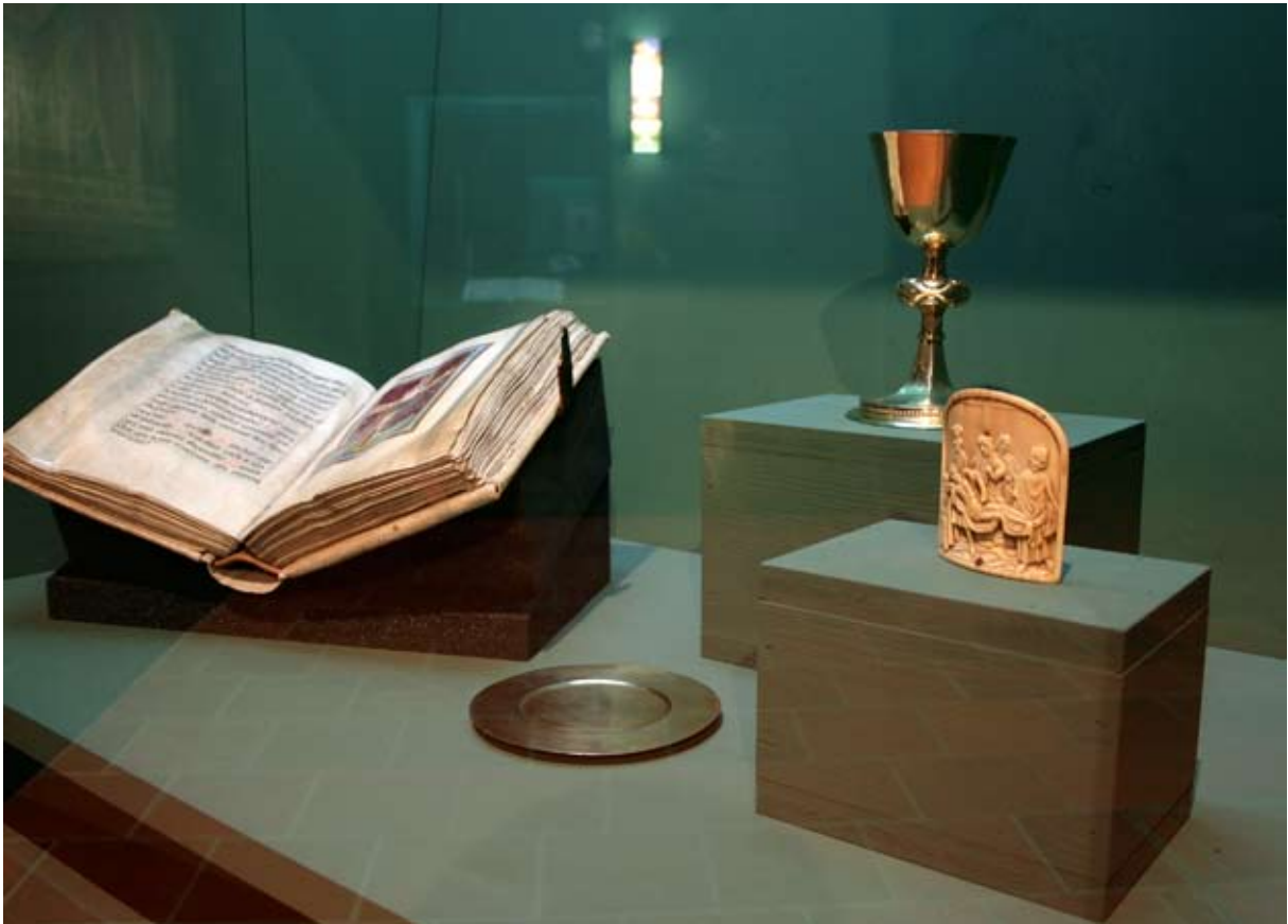
Missale (11. Jh.), Kusstafel (15. Jh.), Kelch und Patene (16. Jh.)

vermittlung existierten, die sich in den Medien manifestierten: Der Kuss der Gläubigen auf die elfenbeinerne Kusstafel (Frankreich, 15. Jh.) gilt zugleich dem auf ihr dreidimensional dargestellten Körper Christi; der Kuss des Priesters auf das Einsiedler Missale (11. Jh.) berührt das Kreuzeszeichen, zugleich den gemalten Körper Christi und den liturgischen Text ( «Te Igitur» ). Wie sich am Einsiedler Graduale studieren lässt, besaßen liturgische Gesänge nicht nur eine semantische und akustische, sondern auch eine visuelle Signifikanz. Die Ausstellung demonstriert mit solchen Objekten komplexer Medialität, dass neben der mittelalterlichen «Schaufrömmigkeit» auch andere sinnliche Wahrnehmungsformen eine grosse Rolle spielten: über Hör-, Seh-, Riech- und Tasterfahrungen waren Heilsübertragungen möglich.