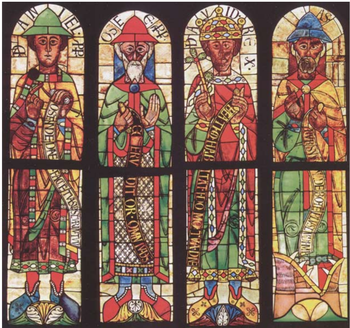
Abb. 1: Daniel, Hoseas, David und Jonas, Obergadenfenster des Augsburger Domes, nach 1132.

bänder mit Passagen aus ihren Weissagungen in den Händen, wobei wechselnd ein heller Schriftzug auf einem dunklen Hintergrund und dunkle Buchstaben auf einer hellen Schriftrolle erscheinen. Diese gläsernen Schriften wirken nicht nur durch ihren Inhalt, sondern besitzen als Bildbestandteile auch ornamentale sowie bildliche Qualitäten und entfalten dank des lichtdurchlässigen Trägermaterials Glas eine besonders intensive