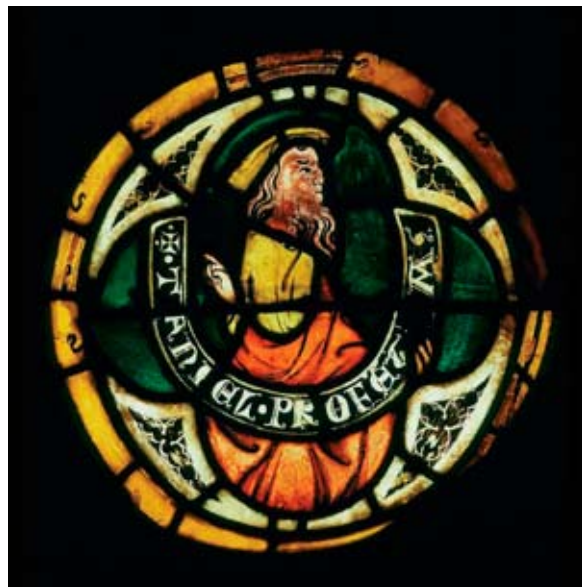
Abb. 2: Prophet Daniel, Fragment aus der Chorverglasung der Zisterzienserkirche von Hauterive (FR), 2. Viertel des 14. Jahrhunderts, heute im Schweizerischen Landesmuseum Zürich, LM 12796.

Auch die Wirkung der Schriftzüge in den gläsernen Bildern beruht zu einem hohen Grad auf der besonderen Materialität des Mediums. Die leuchtenden Buchstaben fordern nämlich vom Betrachter oftmals, den Blick nicht in erster Linie auf den Inhalt der Schrift zu richten, sondern vor allem ihr Erscheinungsbild und ihre materiellen