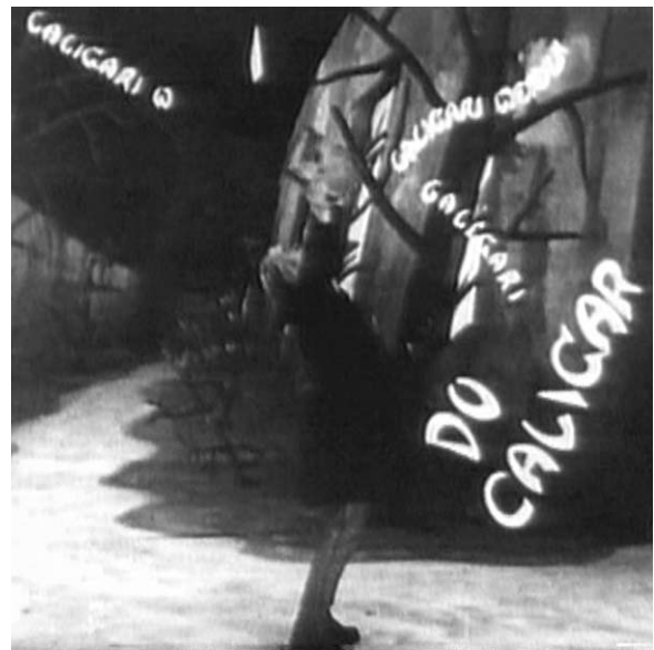
Caligari tanzt mit dem zerfledderten Buch im Park, Filmstill

So stösst man von Anfang an in diesem Film auf Schriftliches: Visitenkarten, Plakate, Aufschriften, Grafiken, Bücher. Am beeindruckendsten ist wohl jene Szene gegen Ende des Films, in der der Protagonist Franzis und einige Ärzte das Büro des Direktors einer psychiatrischen Anstalt durchsuchen, den sie verdächtigen, Dr. Caligari zu sein – ein Wissenschaftler, der einen Somnambulen namens Cesare mittels Hypnose eine Reihe von Morden ausführen liess. Sie betreten ein enges, expressionistisch verschachteltes Gewölbe; hohe Bücherstapel umstellen den kaum sichtbaren Schreibtisch wie ein Festungswall. In einem Geheimfach dieser «Bibliothek», hinter einem Skelett, entdecken Franzis und die Psychiater alsbald den Schlüs-