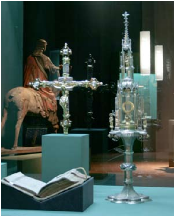
Reliquiar (15. Jh.), Vortragekreuz (14. Jh.), Prozessionale (14. Jh.), Monstranz (16. Jh.)

Praktiken der Übertragung von Heil werden derart nicht nur als funktionale, sondern auch als motivliche Spuren im Parcours der Ausstellung sukzessive lesbar und zeigen sich auf verschiedenen Ebenen in und an den Medien selbst. Das Kloster Einsiedeln war nicht nur Ziel ablasssuchender Pilger, sondern auch ein weitere Medien generierender Gnadenort: Bildliche Reproduktionen der klösterlichen Architektur auf Pilgerzeichen und Medaillen oder Abbildungen der Einsiedler Kapelle auf Kupferstichen sind verschiedenartige Beispiele für Formen von Heilsübertragung, in der die Gnadenmacht dieses berühmten Klosters gleichsam in weit entfernte Gegenden transportiert werden konnte. Pilgerzeichen wurden schliesslich sogar für Glockenabgüsse benutzt, wie sich am Relief auf der Glocke von St. Wolfgang/Hünenberg betrachten lässt: Im Läuten der Glocke dient das derart verarbeitete Pilgerzeichen dazu – wenn auch nunmehr den menschlichen Sinnen unsichtbar und unhörbar – die Heilskraft des Gnadenortes zu aktualisieren.