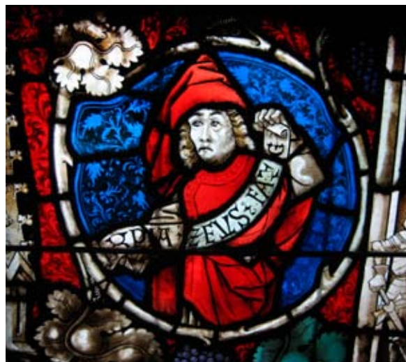
Abb. 3: Prophet aus dem Wurzel-Jesse-Fenster des Berner Münsters, nach 1451.

und visuellen Qualitäten wahrzunehmen. Drei Beobachtungen sollen dies verdeutlichen: